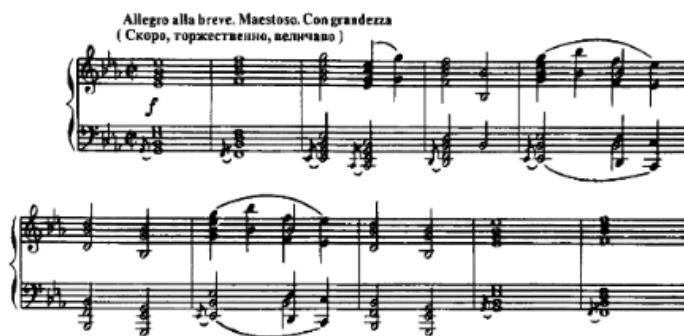
Рисунок 2. Богатырские ворота, «Картинки с выставки» М. П. Мусоргского, 1874 г.

Завершает цикл пьеса «Богатырские ворота», написанная под впечатлением проекта киевских городских ворот. Музыка отличается широтой звучания и праздничным характером (рис. 2). Народно-песенные интонации сочетаются с оборотами, напоминающими церковное пение. Колокольные переклички постепенно заполняют все звуковое пространство. В финале вновь появляется тема «Прогулки», объединяя разные музыкальные картины в единый художественный замысел [2]. Для учащихся знакомство с заключительным номером становится важным этапом осмысления всего образного содержания цикла.