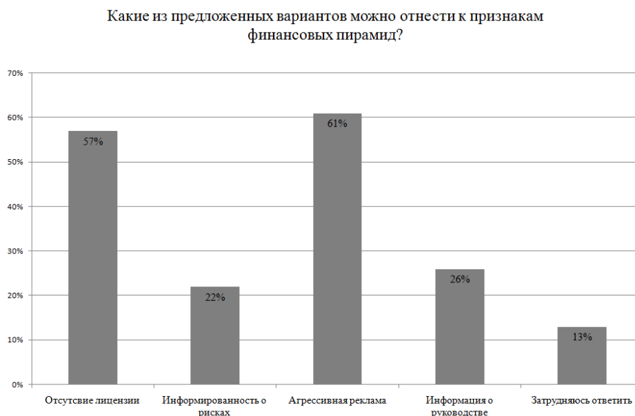
Рисунок 1. Какие из предложенных вариантов можно отнести к признакам финансовых пирамид?

Помимо вопросов с выбором ответа, был задан вопрос, который требовал открытого ответа. На вопрос: можете ли вы привести примеры финансовых пирамид, ответили только 61% опрошенных, 39% затруднились с ответом.