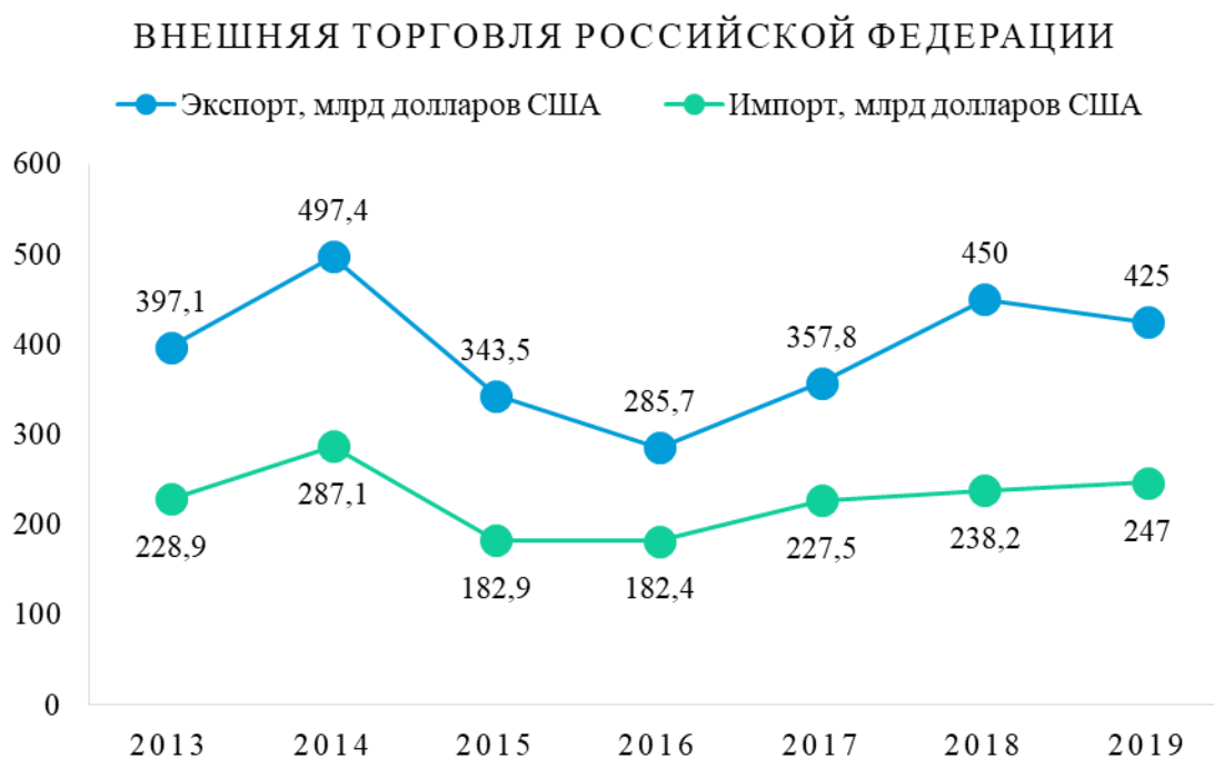
Рисунок 1. Динамика объемов экспорта и импорта в Российской Федерации. [4]