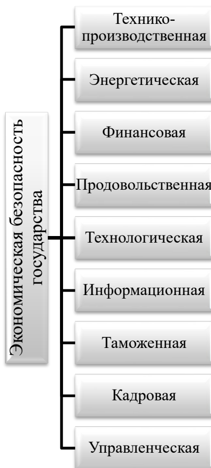
Рисунок 1 – Составляющие экономической безопасности государства [4, с. 130]

Экономическая безопасность государства формируется на основе многочисленных элементов, которые в своей взаимосвязи обуславливают протекание экономических процессов и их результативность. Основные составляющие экономической безопасности государства перечислены на рисунке 1.