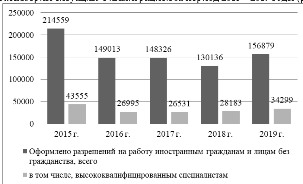
Рисунок 3. Динамика иммиграционной ситуации в РФ в 2015 – 2019 гг., чел.[13]

Теперь рассмотрим ситуацию с иммиграцией за период 2015 – 2019 годы (рис.3).