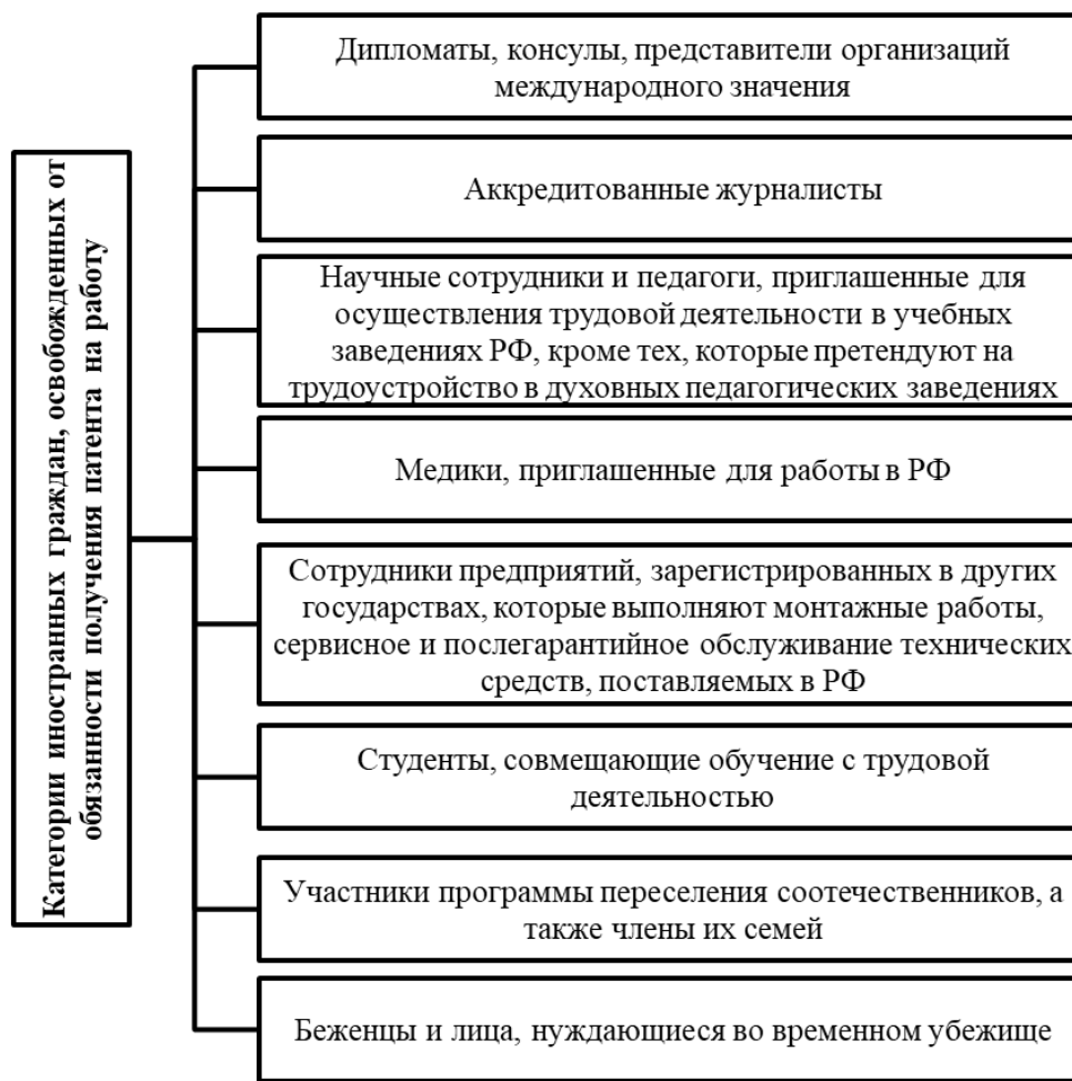
Рисунок 4. Категории иностранных граждан, освобожденных от обязанности получения патента на работу[1]

По профессиям, представленным в перечне лиц, которые освобождены от получения патента на работу, можно сделать вывод о том, что большая часть является высококвалифицированными кадрами (дипломаты, консулы, представители организаций международного значения; аккредитованные журналисты; научные сотрудники, педагоги и медики).